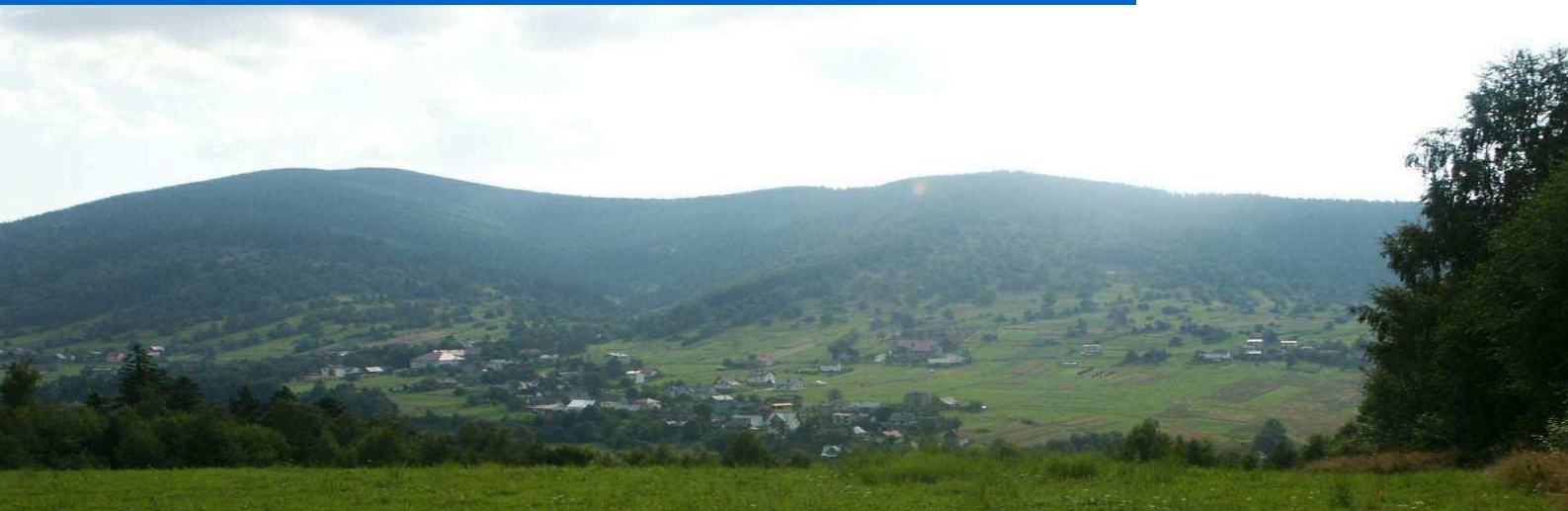
Fot. 1. Widok na centralną część Sopotni Wielkiej z „Krzyżowskiego Gronia”.

Opracowano ze środków własnych Stowarzyszenia POLARIS – OPP