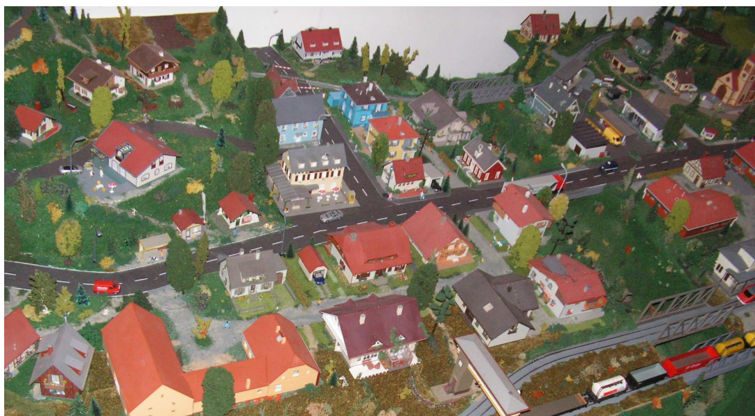
Fot. 3. Wizja Sopotni Wielkiej w przyszłości – makieta w skali H0 autorstwa młodych mieszkańców.

Plan jest dokumentem, który podlegać może modyfikacjom, wprowadzane mogą być dodatkowe zadania uznane za ważne dla mieszkańców, inne mogą być z niego usuwane. Decydujący wpływ na jego realizację będzie miało pozyskiwanie środków ze źródeł innych niż budżet gminy. Fakt ten może determinować kolejność i zakres realizowanych zadań. Zmiany w Planie wprowadzane mogą być w sposób analogiczny do jego przyjęcia. Konkretnie zadania wdrażane będą w oparciu o dokumentację techniczną, studia wykonalności i opisy projektów. Zawierać będą szczegółowe cele zadania, kosztorys, harmonogram, uzasadnienie i szczegółowy opis.